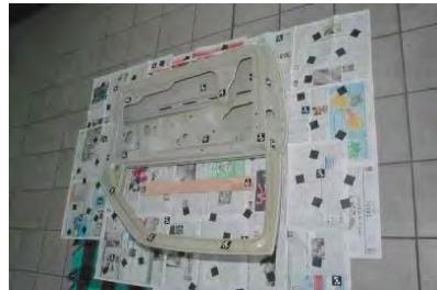
Abbildung 2: Bilder 12 und 13 der Bildsequenz Autotür.

Das Ergebnis für insgesamt 23 Aufnahmen ist in Abbildung 3 dargestellt. Es wurde ein \sigma_0 von 0.13 Pixel erzielt. Insgesamt ergaben sich 1580 3-fach, 951 4-fach, 372 5-fach, 252 6-fach, 245 7-fach, 210 8-fach, 141 9-fach, 179 10-fach, 94 11-fach und 14 12-fach Punkte. Hierbei ist zu beachten, dass Punkte nur so lange betrachtet werden, wie sie im nächsten Bild wiedergefunden werden. Punkte, die verloren gehen, werden neu initialisiert. Dieses Vorgehen vermeidet, dass in späteren Bildern verdeckte Punkte in Textur-reichen Bildern halluziniert werden.