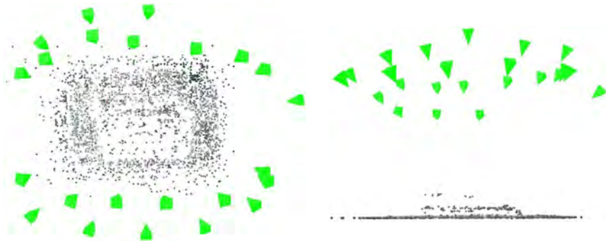
Abbildung 3: Ergebnis für die Bildsequenz Autotür, für die die Bilder 12 und 13 in Abbildung 2 dargestellt sind – Ansicht von oben (links) und von der Seite (rechts)

Das Resultat zeigt, dass für die vorgegebenen Bilder, auch bei größeren Rotationen und projektiven Verzerrungen eine Zuordnung mit hoher Genauigkeit möglich ist. Der nächste Schritt, an dem im Moment gearbeitet wird, besteht darin, diese Ergebnisse dazu zu verwenden, um die (unkodierten) Messmarken zwischen den Bildern auf Grund der bekannten Epipolargeometrie sowie von aus den kalibrierten Kameramatrizen ableitbaren Trifokalensoren zuzuordnen. Dies würde einen Vergleich der erzielbaren Genauigkeiten ermöglichen. Eine Hypothese besteht hierbei darin, dass ähnlich wie bei der automatischen Aerotriangulation die Orientierungen bei genügend Textur auch ohne Messmarken sehr genau bestimmt werden kann, auch wenn die einzelnen Punkte (natürlich) weniger genau bestimmt werden.