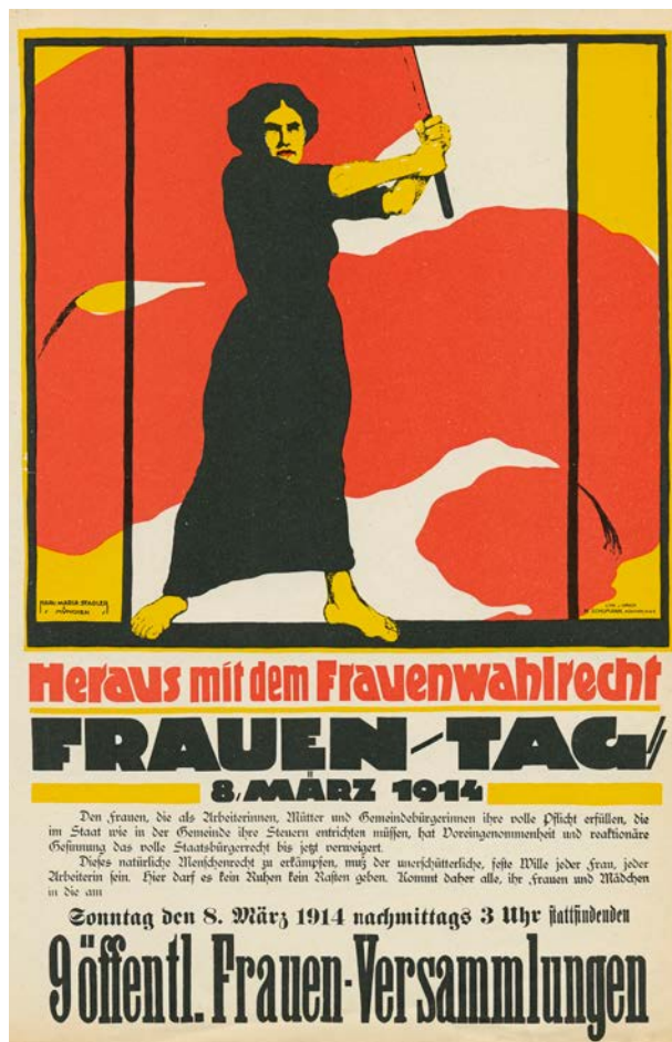
Plakat für das Frauenwahlrecht: Gleichheit für alle

Das wird nicht ohne Zumutungen für die Bevölkerung gehen. Zumutungen müssen wieder möglich werden, wenn die Demokratien überleben wollen – sei es die Wehrpflicht oder eine Politik, die der Zerstörung der Ökologie und damit auch unserer Lebensgrundlage endlich ein Ende setzt.