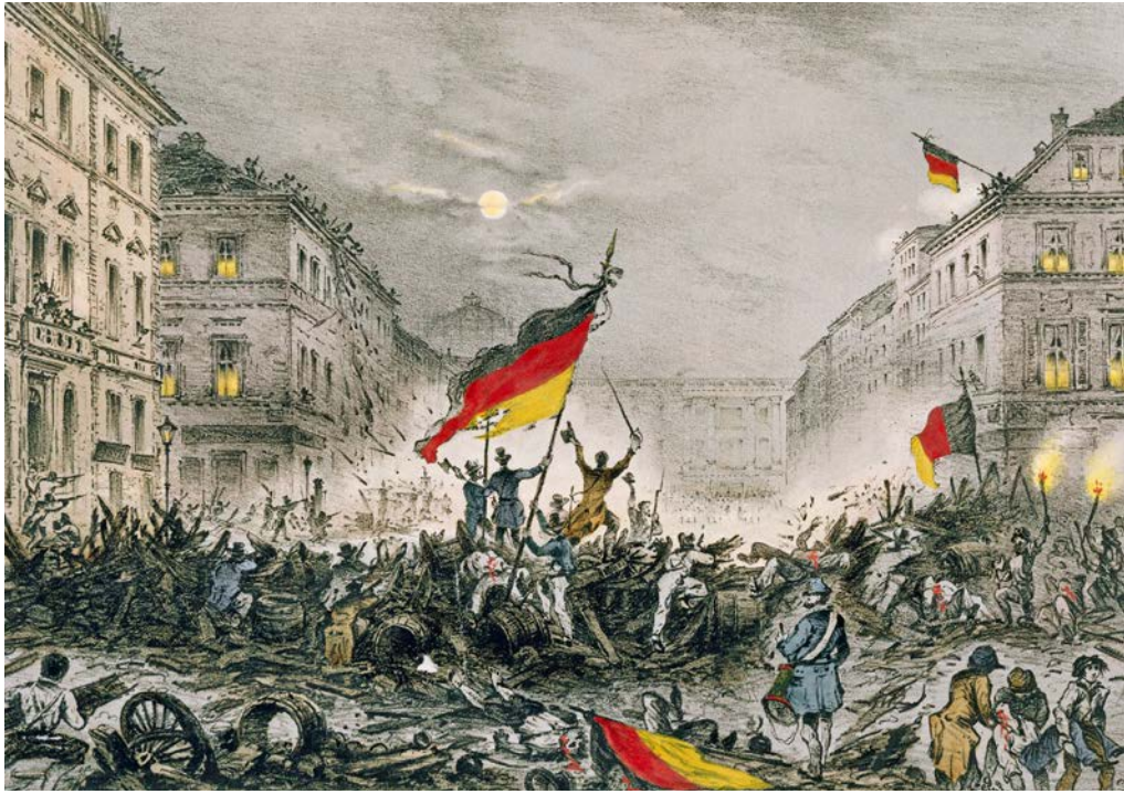
Märzrevolution in Berlin 1848 (Kreidelithografie): Kampf um politische Rechte

Menschen universelle, unveränderliche Rechte zugestand, werde von allen als ein »sentiment intérieur« geteilt.