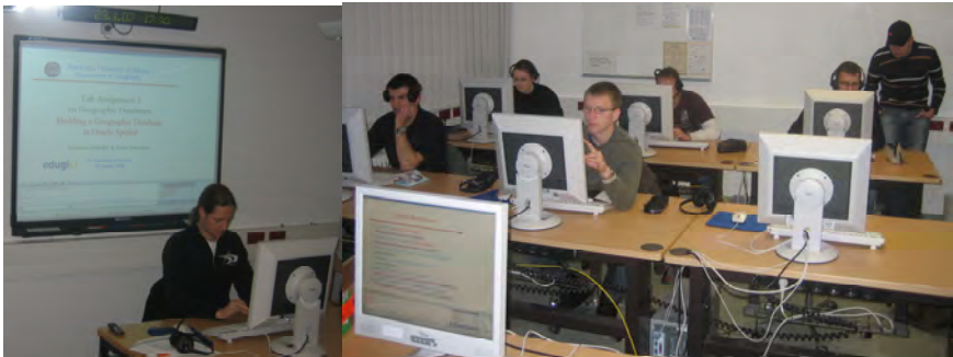
Abb. 3.: Tutor und Studenten während einer Sitzung

Die Kurse, die jedes der Partnerinstitute erhält, müssen so ausgewählt werden, dass sie sich zeitlich und thematisch in den Studienplan integrieren lassen und diesen sinnvoll ergänzen, was in der Praxis in unterschiedlichen Ländern mit unterschiedlichen Semesterzeiten und Curricula nicht immer einfach ist. Im Rahmen des eduGI Projektes erhalten die Studenten der Universität der Bundeswehr von der Harokopio Universität Athen einen Kurs über Geodatenbanken und von der Universität Münster einen Kurs zum Thema Projektmanagement. Letzterer ist derzeit im Gange, so dass hier nur als Zwischenbilanz erwähnt werden kann, dass er bisher einen positiven Zuspruch findet.