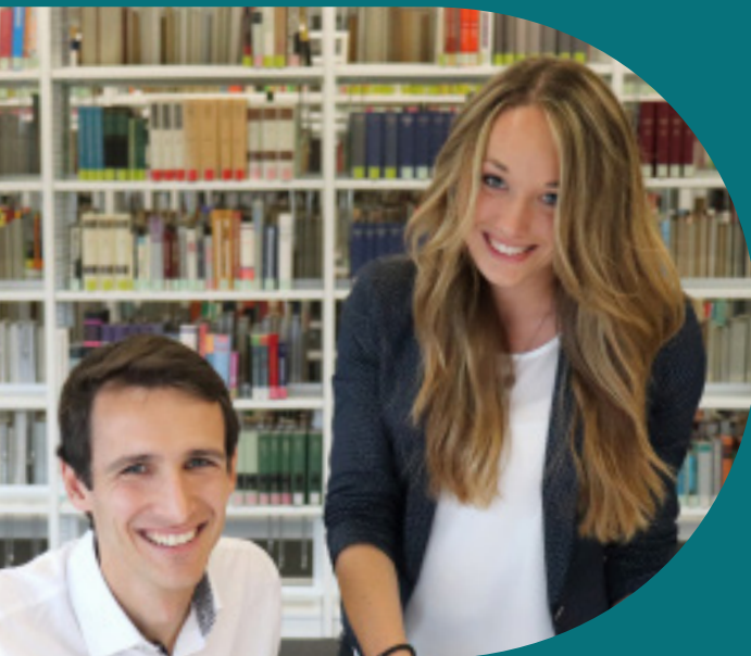
Master-Studiengang (M. A.)