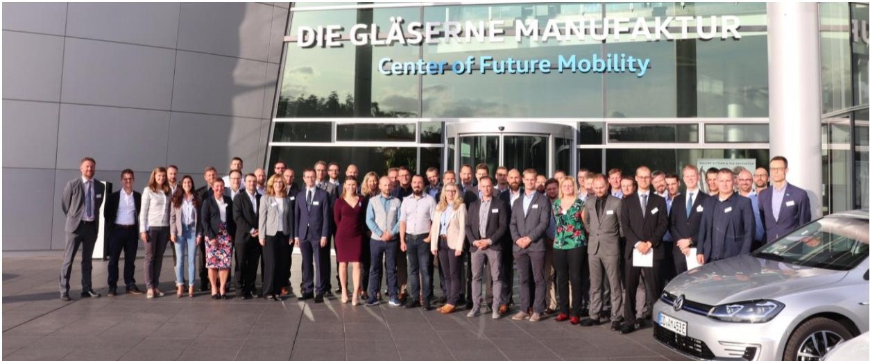
Impression 7. MFAO-Jahrestagung 2016